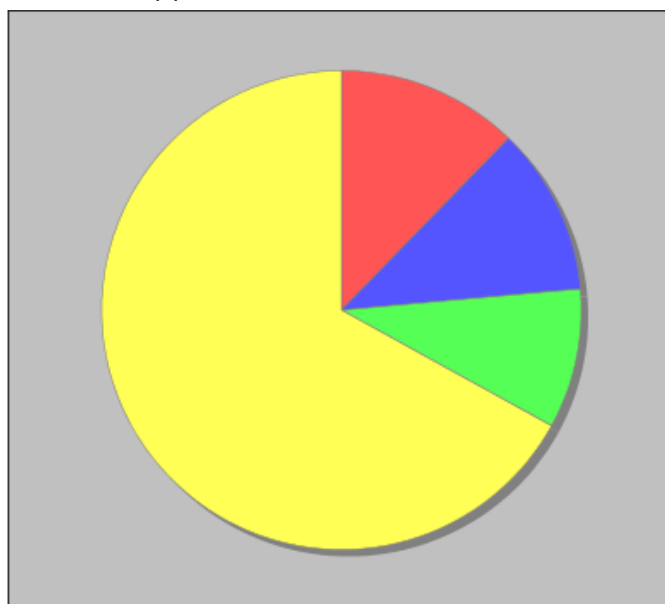
Distribuzione dei docenti a T.I. per anzianità nel ruolo di appartenenza (riferita all'ultimo ruolo)